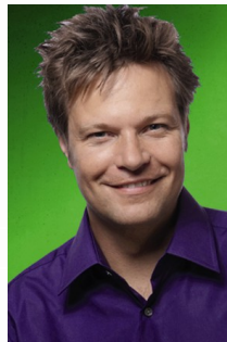
Dr. Robert Habeck

„Das Urteil des Landesverfassungsgerichts ist für die Demokratie Niederlage und Chance zugleich gewesen. Es gibt uns die Möglichkeit, aber auch die Pflicht, dafür zu sorgen, dass eine demokratische Legitimation da verortet wird, wo Entscheidungen stattfinden. Das heißt aber auch, dass wir neue Wege beschreiten werden und alte Pfade verlassen müssen. Nur so kann das Viereck aus Demokratie-Bürgernähe-Heimat-Effizienz neu justiert werden.“